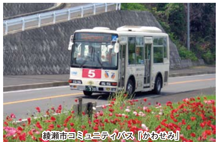
綾瀬市コミュニティーバス「かわせみ」

要望に併せて、市内に細かく路線網をつくる方策では、既存車両入れ替えのタイミングに合わせて、11人定員の小型ワゴン車の導入（座間市では採用されています）や、各地で採用されている「デマンドバス方式」といって、事前に利用者が電話・FAX・メールなどで連絡を入れ、その要望に併せて、バス路線を迂回させる運行方法もあり、今後のコミュニティーバスの運営方法が研究されています。