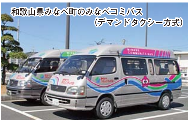
和歌山県みなべ町のみなべコミバス (デマンドタクシー方式)