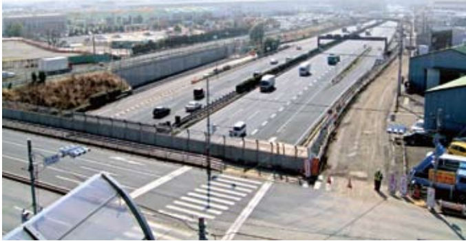
都市基盤整備の要である東名インターチェンジ建設予定地

現在では現東名に綾瀬インターチェンジの新設が推進され、市道・県道の整備の起爆剤となり、また早川城山・深谷中央区画整理事業も住宅地確保策が決定・推進されています。